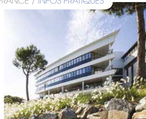
De gauche à droite : CHU d'Amiens – Centre Antoine Lacassagne, Centre de lutte contre le cancer de Nice – Institut de Cancérologie de l'Ouest, Nantes