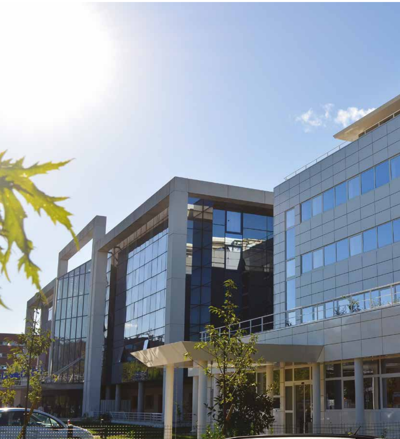
Clinique Claude Bernard, Ermont